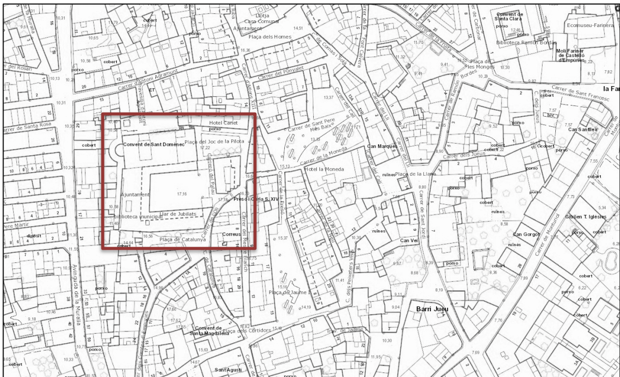
Fig. 1: Plànol topogràfic de la zona en el que s'indica l'emplaçament de l'edifici del convent de Sant Domènec, avui seu de l'Ajuntament, al nord del qual s'aixeca l'església ( http://www.icc.cat/vissir3/ )

L'edifici correspon a la finca cadastral núm. 6186605EG0768N0001DO, amb adreça a la plaça del Joc de la Pilota núm. 1 (Fig. 3). Aquí és on es troba l'accés a l'església així com la porta que permet entrar al claustre.